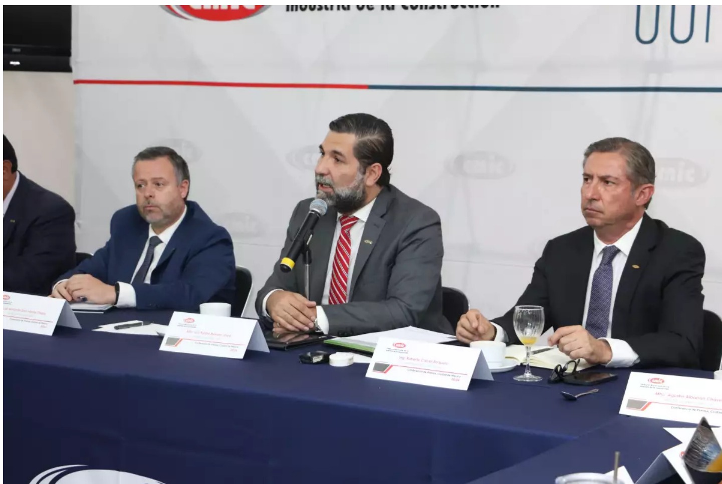
El organismo propone la reactivación del Fondo Metropolitano.