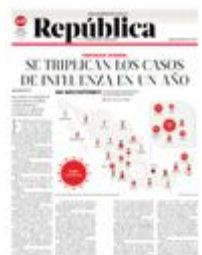
Gráfico: Rodolfo Gómez García