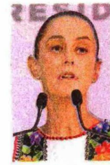
DIEGO SIMÓN, EL UNIVERSAL

:::: Llegó el momento de pensar en los actos de cierre de campaña, y nos comentan que el equipo de la candidata presidencial de Morena, Claudia Sheinbaum , se encuentra definiendo el lugar del acto, y tiene tres opciones. Hasta el momento, nos dicen, se considera el Monumento a la Revolución, el estadio azulgrana, y el Autódromo Hermanos Rodríguez. No obstante, y pese que ya comenzaron los trabajos de remodelación rumbo al Mundial del 2026, nos dicen que podrían buscar hacerlo en el Estadio Azteca. Mientras tanto, el festejo, en caso de ganar el 2 de junio, aseguran que será en el Zócalo capitalino.