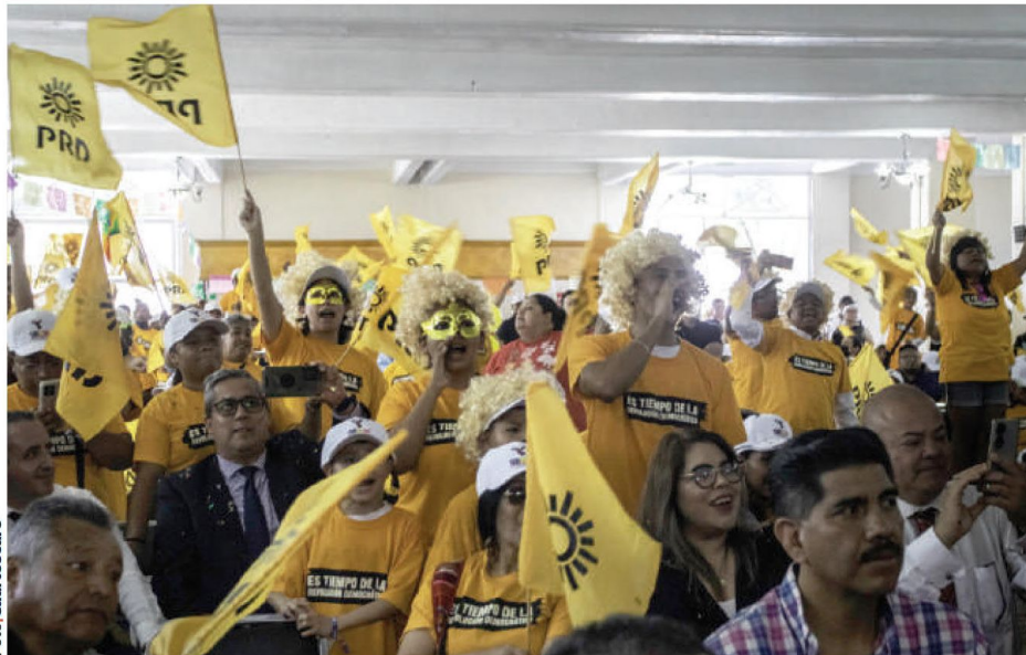
SIMPATIZANTES del PRD durante un mitin de Santiago Taboada, el 4 de marzo.