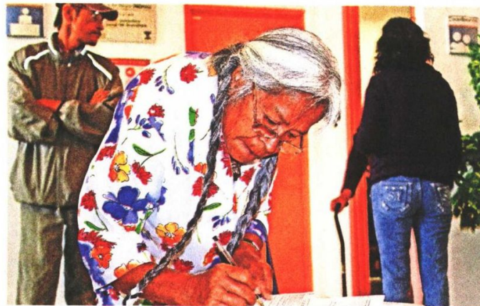
El monto destinado al pago de pensiones es mucho menor a lo que se gasta en la operación de la entidad dedicada a cubrir ese concepto.

Como se indicó en la Conferencia Matutina del Presidente de los Estados Unidos Mexicanos del 1 de julio de 2024, el Instituto Mexicano del Seguro Social (IMSS) emitió 249 solicitudes de pensión de trabajadores, que fueron sujetas de recibir el complemento de pensión y el Instituto de Seguridad y Servicios Sociales de los Trabajadores del Estado (ISSSTE) emitió 31 concesiones de pensión de trabajadores que también fueron sujetas de recibir dicho complemento, que implican egresos del Fondo por 989,844.31 pesos para el primer pago de los casos del IMSS y de 94,262.48 pesos de los casos del ISSSTE, esperándose que los casos de trabajadores con derecho al complemento de pensión se incrementen paulatinamente.