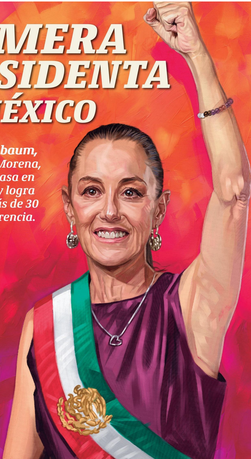
Ilustración: Gilberto Bobadilla para ejeCentral

Claudia Sheinbaum, candidata de Morena, PT y PVEM arrasa en las elecciones y logra triunfo con más de 30 puntos de diferencia. Pág. 6