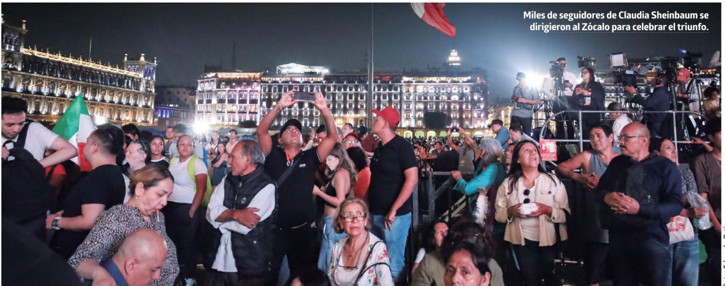
Miles de seguidores de Claudia Sheinbaum se dirigieron al Zócalo para celebrar el triunfo.

DESPUÉS DE LAS 7 DE LA NOCHE, VARIAS ENCUESTAS DE SALIDA DIERON COMO GANADORA A LA CANDIDATA DE MORENA-PT-PVEM, CLAUDIA SHEINBAUM; MOMENTOS ANTES, XÓCHITL GÁLVEZ, DE PAN-PRI-PRD, SE HABÍA PROCLAMADO VENCEDORA Y LLAMÓ A SUS SEGUIDORES A DEFENDER LOS RESULTADOS.