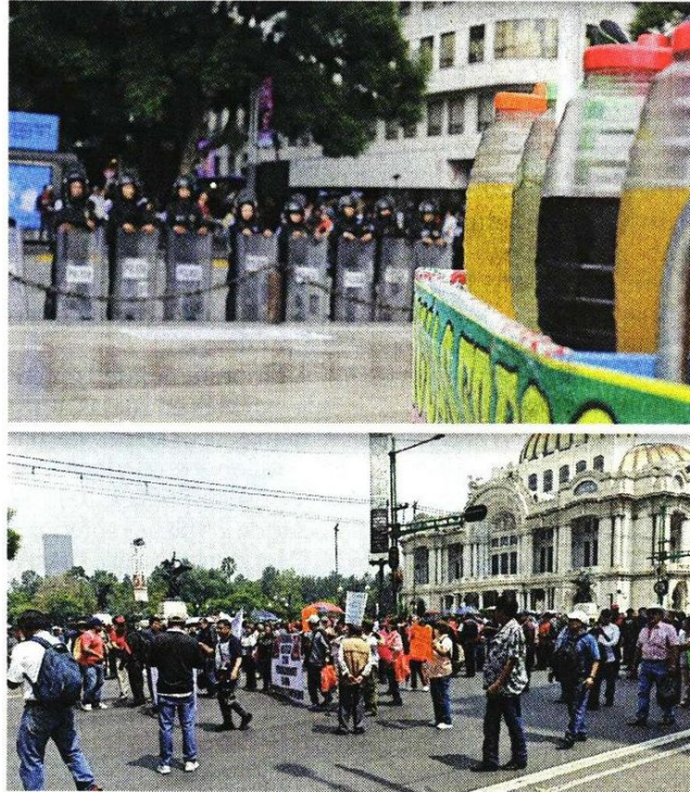
■ De bloquear Juárez y Eje Central (arriba), los comerciantes se agruparon en la explanada del Palacio de Bellas Artes.