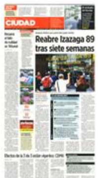
APERTURA EXPRES. El martes por la noche los sellos de clausura fueron retirados; ayer, el inmueble comenzó a operar.