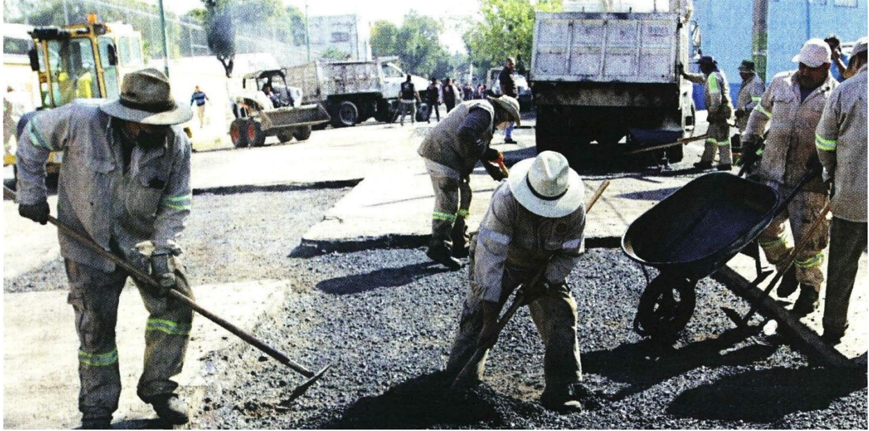
¡BUENOS DÍAS! El ruido de las cuadrillas de asfalto despertó a los vecinos de la Colonia Federal, de las más afectadas.