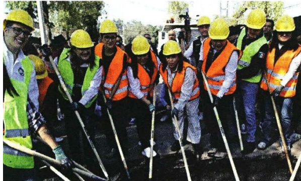
■ La Jefa de Gobierno y los alcaldes iniciaron ayer el programa conjunto de intervención de vialidades capitalinas.

“No es un problema menor, es un tema de movilidad y de infraestructura urbana, con ello vamos a acabar con los daños a los vehículos, a la congestión vehicular”.