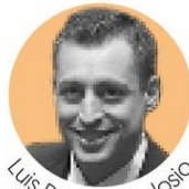
Luis Donaldo Colosio