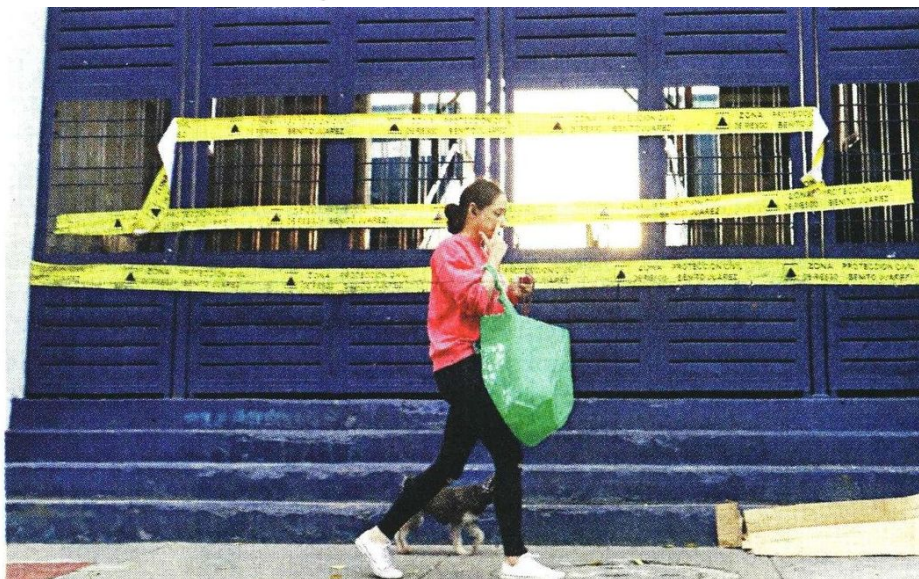
Vecinos encontraron el Azul con las cintas de suspensión y sin la actividad dominical usual.