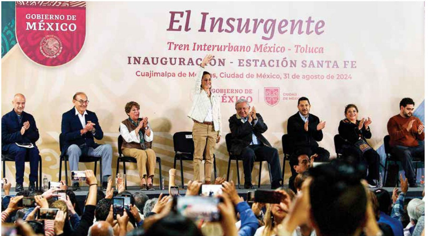
COORDINACIÓN | • Sheinbaum y AMLO encabezaron el acto donde también estuvieron Delfina Gómez, Clara Brugada y Martí Batres.