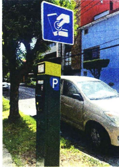
■ Las obras estarán finalizando en julio.