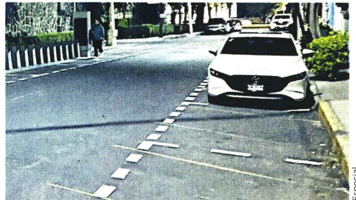
■ En calles de la colonia ya son trazados los cajones de estacionamiento.