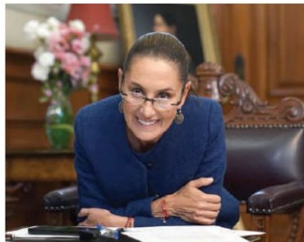
LA PRESIDENTA, Claudia Sheinbaum, ayer, en llamada con Donald Trump.

SHEINBAUM charla por teléfono con el futuro jefe de la Casa Blanca; espera colaboración; ante retos "estamos preparados y hay mucha unidad", aclara.