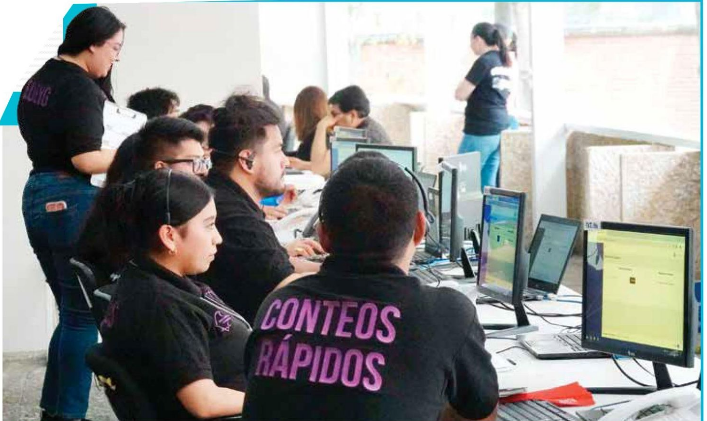
APRUEBA | • El Centro de conteos rápidos del instituto electoral capitalino realiza ensayos previo al día de la jornada electoral.