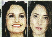
Susana Harp Claudia Curiel