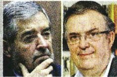
Juan Ramón de la Fuente Marcelo Ebrard