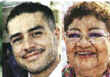
Omar García Harfuch Ernestina Godoy