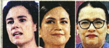
Luisa María Alcalde Ariadna Montiel Rosa Icela Rodríguez