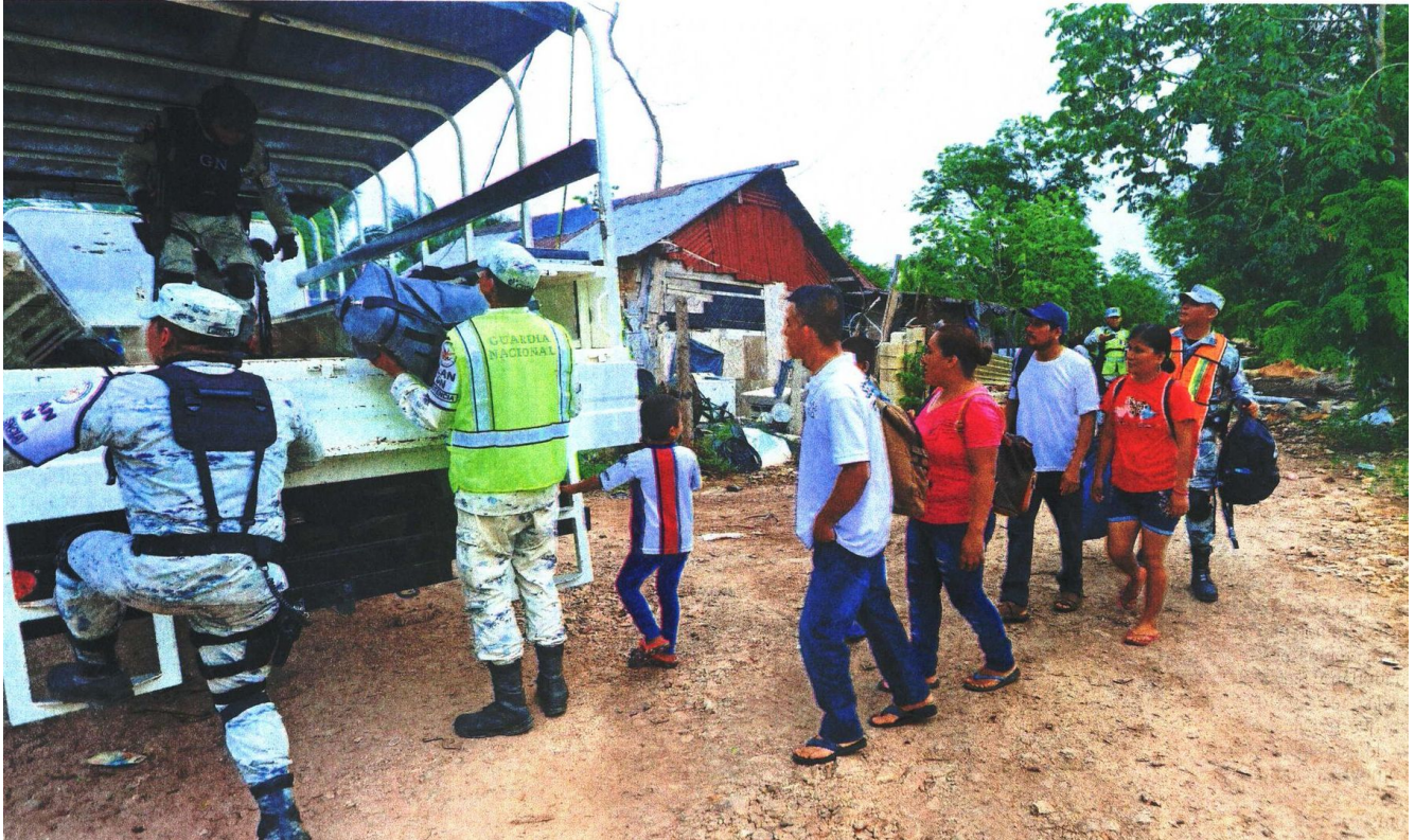
Aunque en un principio la invitación de las Fuerzas Armadas para evacuar fue rechazada por desconfianza, finalmente varias familias aceptaron ir a los albergues.