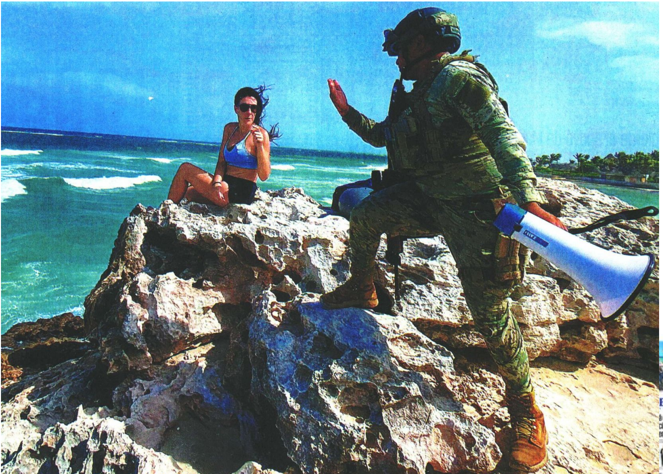
En Tulum, un elemento de la Marina pide a una turista que se retire de la playa antes de la llegada del huracán. Autoridades de la ciudad emitieron una declaratoria de emergencia.