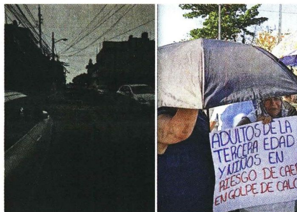
■ En el Edomex se reportaron apagones y en Mérida colonos protestaron para exigir a la CFE que vrestablezca el servicio.

En la entidad al menos 50 colonias del Área Metropolitana de Guadalajara se quedaron sin agua, según el Gobernador Enrique Alfaro, porque, por los apagones, se dañó la principal planta de bombeo del Lago de Chapala.