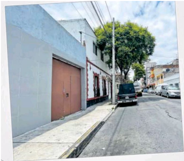
D Casa de Ana última víctima de la Mataviejitas