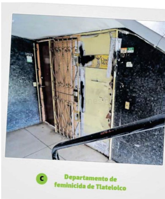
C Departamento de feminicida de Tlatelolco