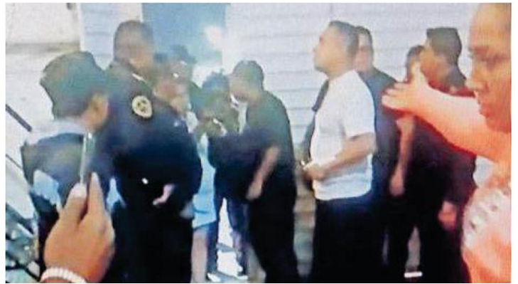
Personal de la Dirección General de Asuntos Internos de la Secretaría de Seguridad Ciudadana tomaron conocimiento del evento e iniciaron la carpeta de investigación correspondiente