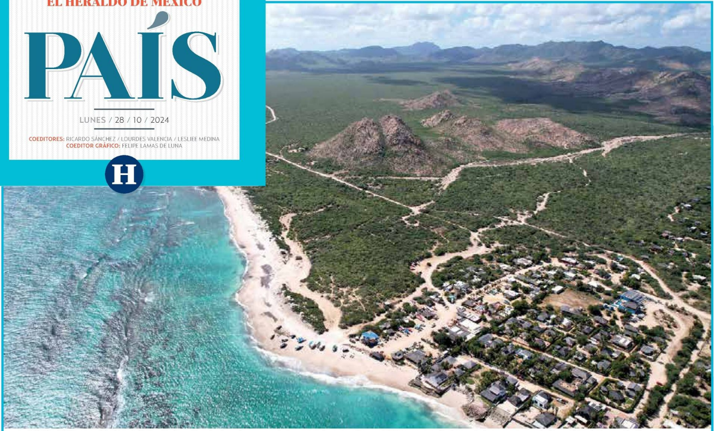
JOYA. El Parque Nacional Cabo Pulmo fue declarado como área natural protegida en 1995; es una de las más importantes de la región del mar de Cortés.