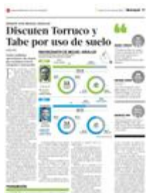
Gráfico: Rodolfo Gómez García