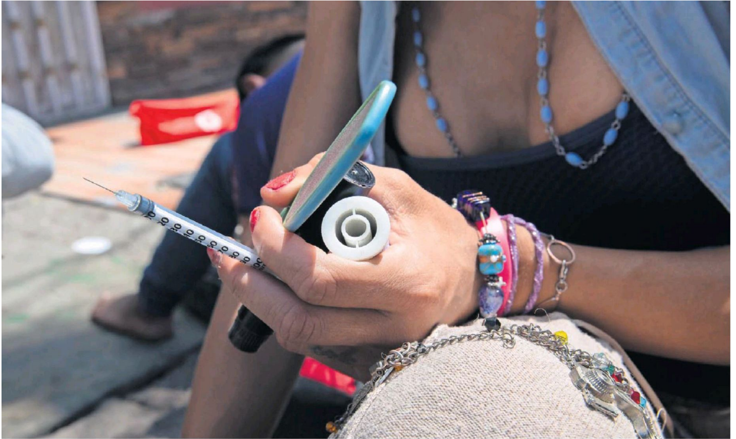
El fentanilo en México se consume inyectado o fumado. La sustancia ilícita puede provocar una sobredosis que colapsa el sistema respiratorio y es potencialmente mortal.