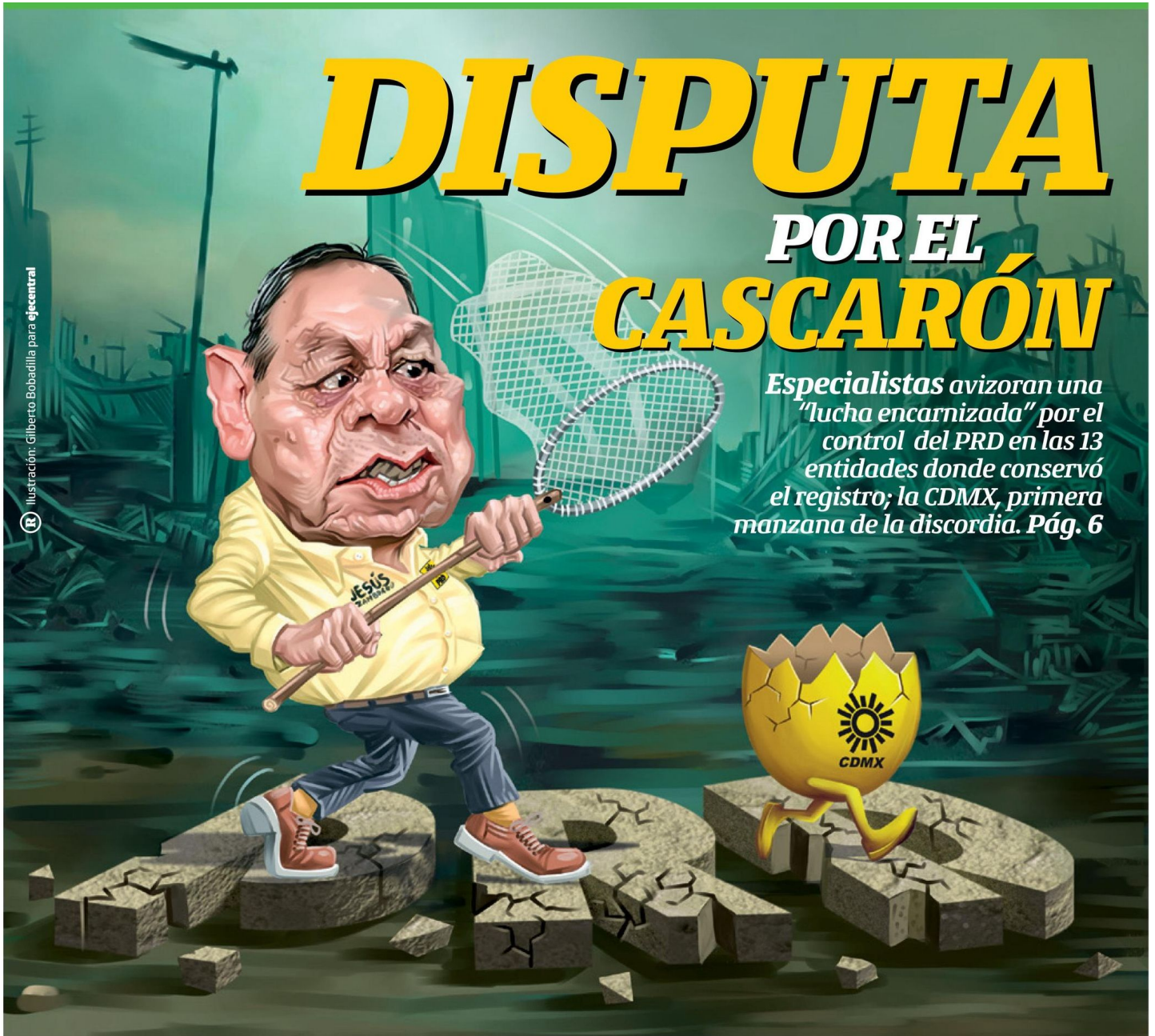
Ilustración: Gilberto Bobadilla para eje central

Especialistas avizoran una "lucha encarnizada" por el control del PRD en las 13 entidades donde conservó el registro; la CDMX, primera manzana de la discordia. Pág. 6