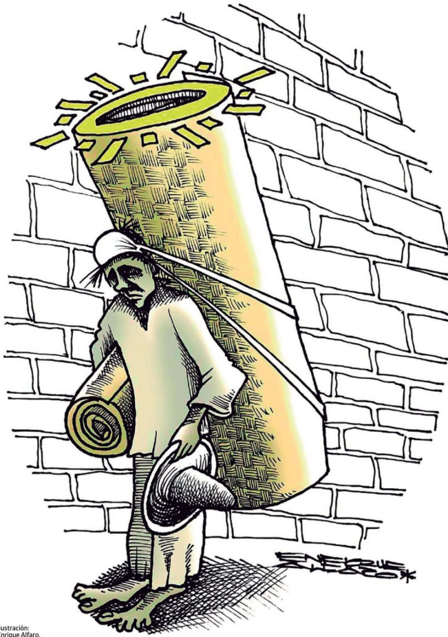
Ilustración: Enrique Alfaro.