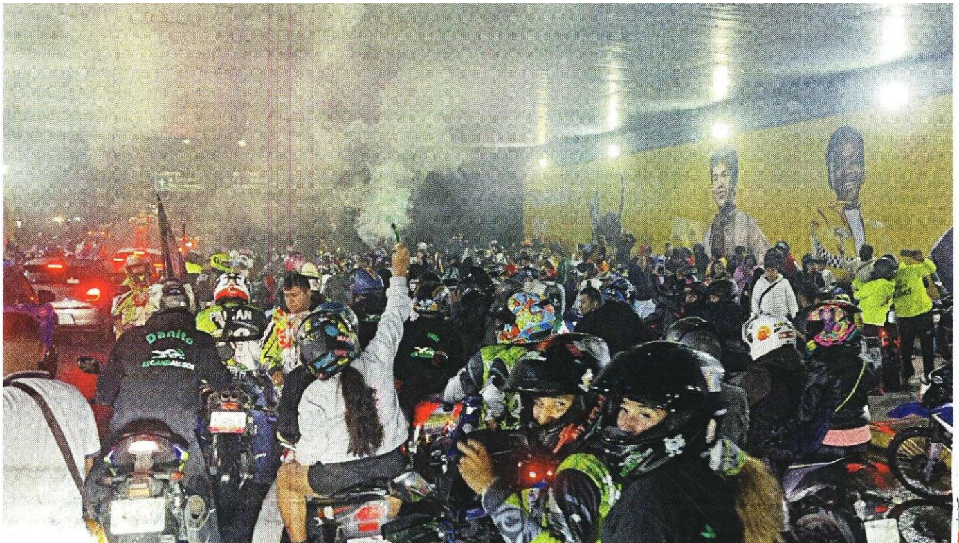
DESORDEN. La lluvia hizo que el punto de reunión fuera el bajopunte, donde se lanzaron bengalas de humo como señal. cen en rodadas arquía y delitos