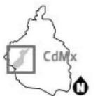
Gráfico: Rodolfo Gómez García