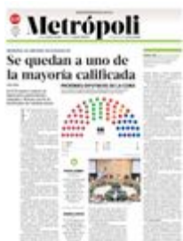
Gráfico: Delia Gómez García