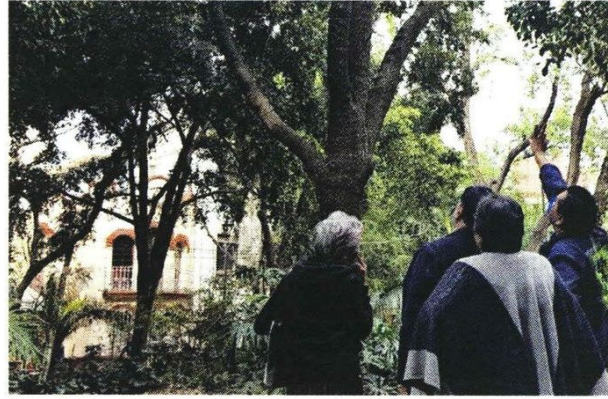
Vecinos y personal de la PAOT inspeccionaron esta semana el arbolado dañado en la Colonia Hipódromo.