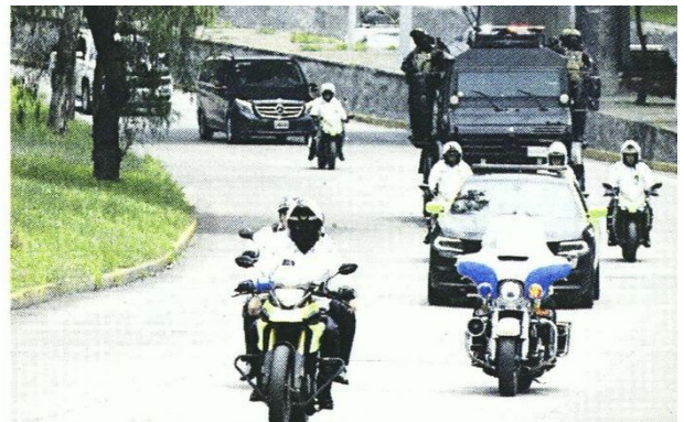
La carroza fue escoltada hasta el Aeropuerto Internacional de Toluca, donde el cuerpo sería llevado a Aguascalientes.