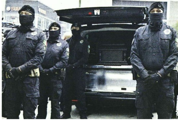
■ Elementos hicieron guardias de honor durante el funeral.