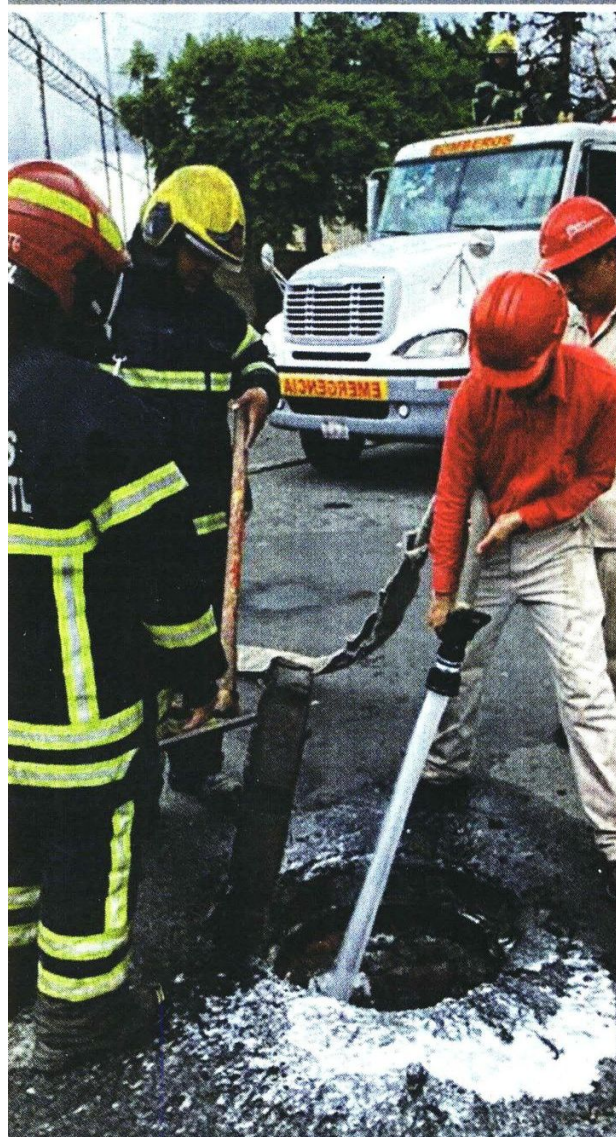
Personal de Pemex y de Bomberos continuó ayer con las labores de limpieza en el drenaje de la Colonia Ciudad Lago.