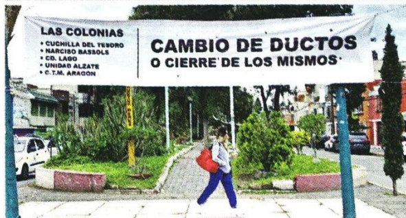
■ Con lonas, vecinos piden el cambio o cierre de ductos en cinco colonias; olor a combustible sigue en alcantarillas.