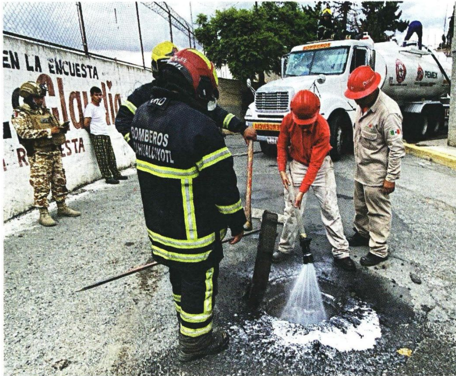
■ Pese a las exhaustivas limpiezas que personal de Pemex ha realizado en el alcantarillado, el olor a combustible persiste en colonias de Gustavo A. Madero y Nezahualcóyotl.