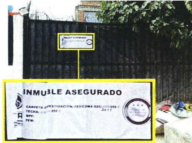
Una vivienda ubicada en la esquina de las calles 699 y 604, en Ciudad Lago, fue asegurada por una toma ilegal de combustible.