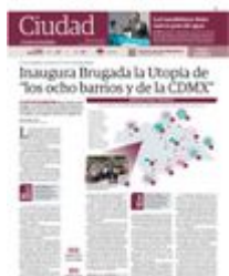
CLARA BRUGADA inauguró la treceava Utopía, ayer.