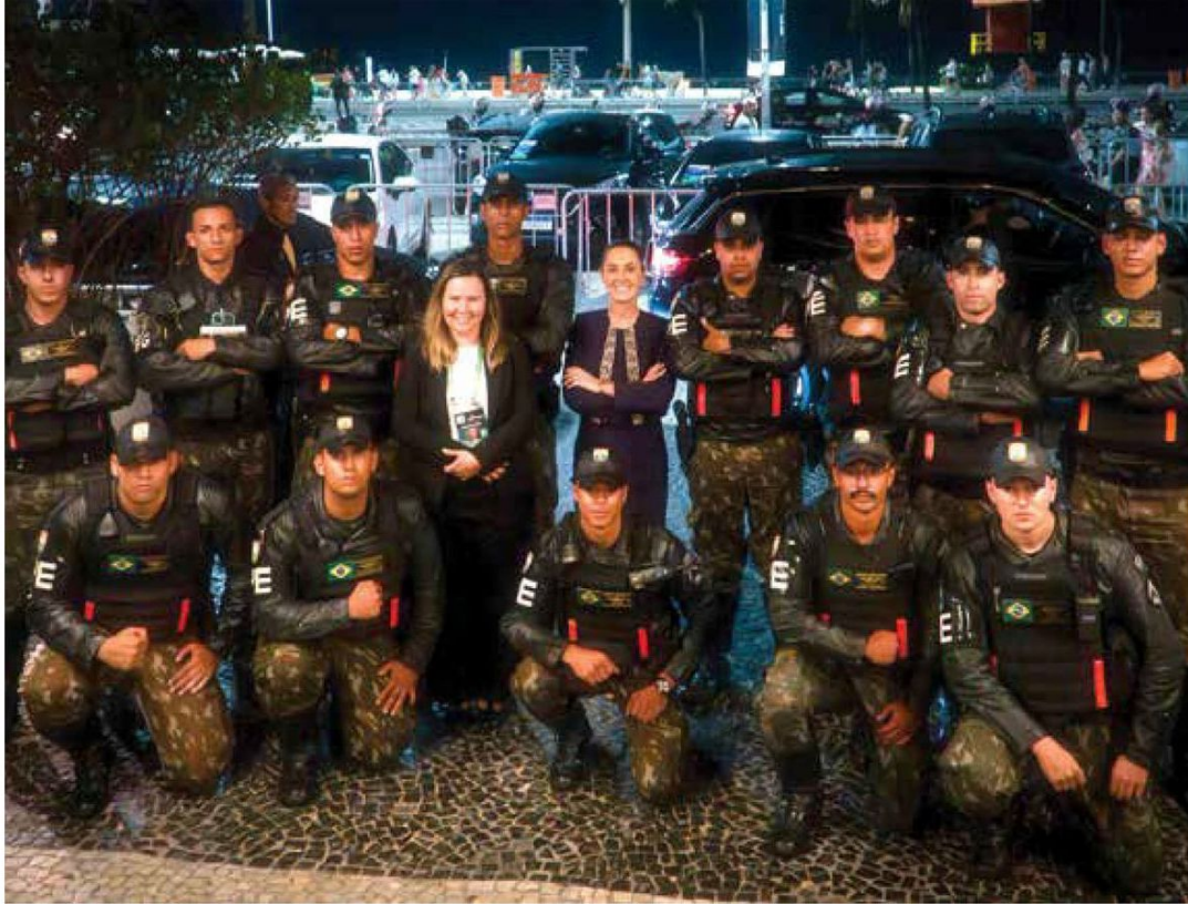
• MEMORIA. Sheinbaum se fotografió con el Segundo Batallón de Policía del Ejército de Brasil.