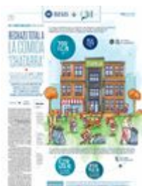
GRÁFICO: IVÁN BARRERA

Entrevista telefónica. La selección de números telefónicos en la República Mexicana se realizó de manera aleatoria. Es un estudio auto ponderado ya que todos los números tienen la misma probabilidad (mayor a cero) de ser seleccionados. Se ajustaron parámetros de población del país por Estado: sexo y edad con el último listado nominal con corte de 2024. Fecha: del 29 al 31 de octubre de 2024. Margen de error: +/-3.53%. Nivel de confianza: 95%. Muestra: 800 encuestas efectivas.