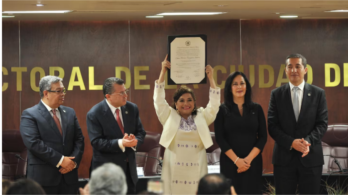
Dan constancia de validez a la elección a la Jefatura de Gobierno CDMX. Magistrados del TECDMX dan constancia a Clara Brugada como jefa de Gobierno del 5 de octubre del 2024 al 4 de octubre de 2030.

En sesión solemne el Tribunal Electoral de la CDMX entregó la constancia a Clara Brugada, para ejercer el cargo de jefe de Gobierno desde el próximo 5 de octubre