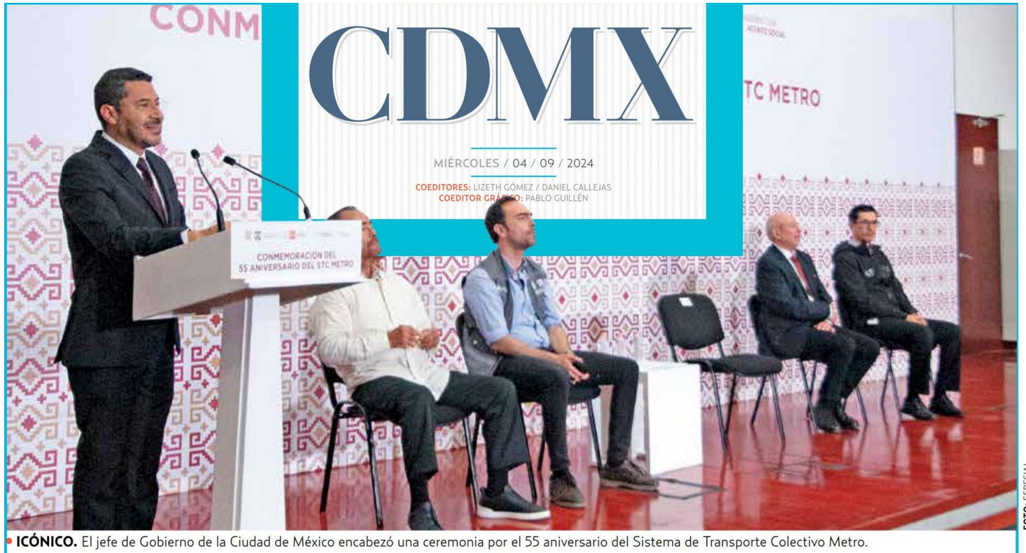
• ICÓNICO. El jefe de Gobierno de la Ciudad de México encabezó una ceremonia por el 55 aniversario del Sistema de Transporte Colectivo Metro.