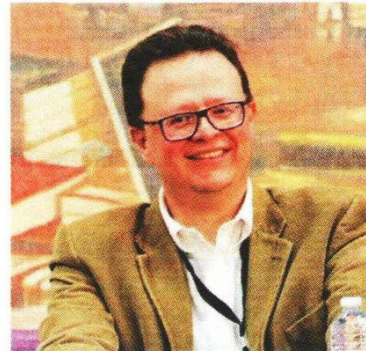
EL MAGISTRADO Felipe de la Mata, autor de la novela, en imagen de archivo.

Las heridas retrata también el primer amor, la reconciliación y la esperanza, así como un país violento y a la vez inocente. Es una novela coming of age , es decir, que retrata una etapa de crecimiento tanto de sus personajes como del país y todas las emociones que esto conlleva: dolor, gozo, ilusión y esperanza y confusión.