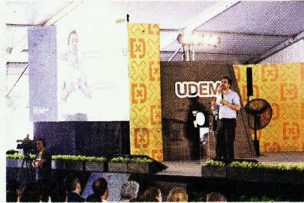
■ Jorge A. Máynez, candidato presidencial de Movimiento Ciudadano, sostuvo un encuentro en la UDEM.