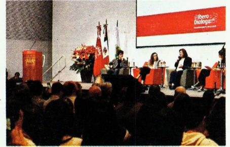
■ Xóchitl Gálvez, candidata presidencial por la coalición PAN-PRI-PRD, se reunió con alumnos de la Ibero.