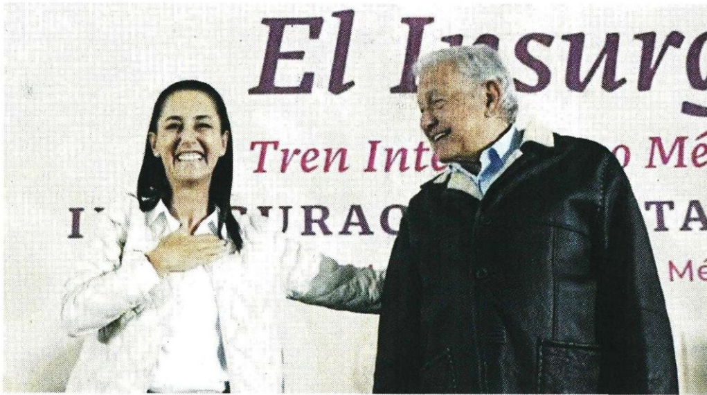
La Presidenta electa Claudia Sheinbaum y el Presidente Andrés Manuel López Obrador inauguraron ayer la estación Santa Fe del Tren El Insurgente, que conecta al Edomex y la CDMX.