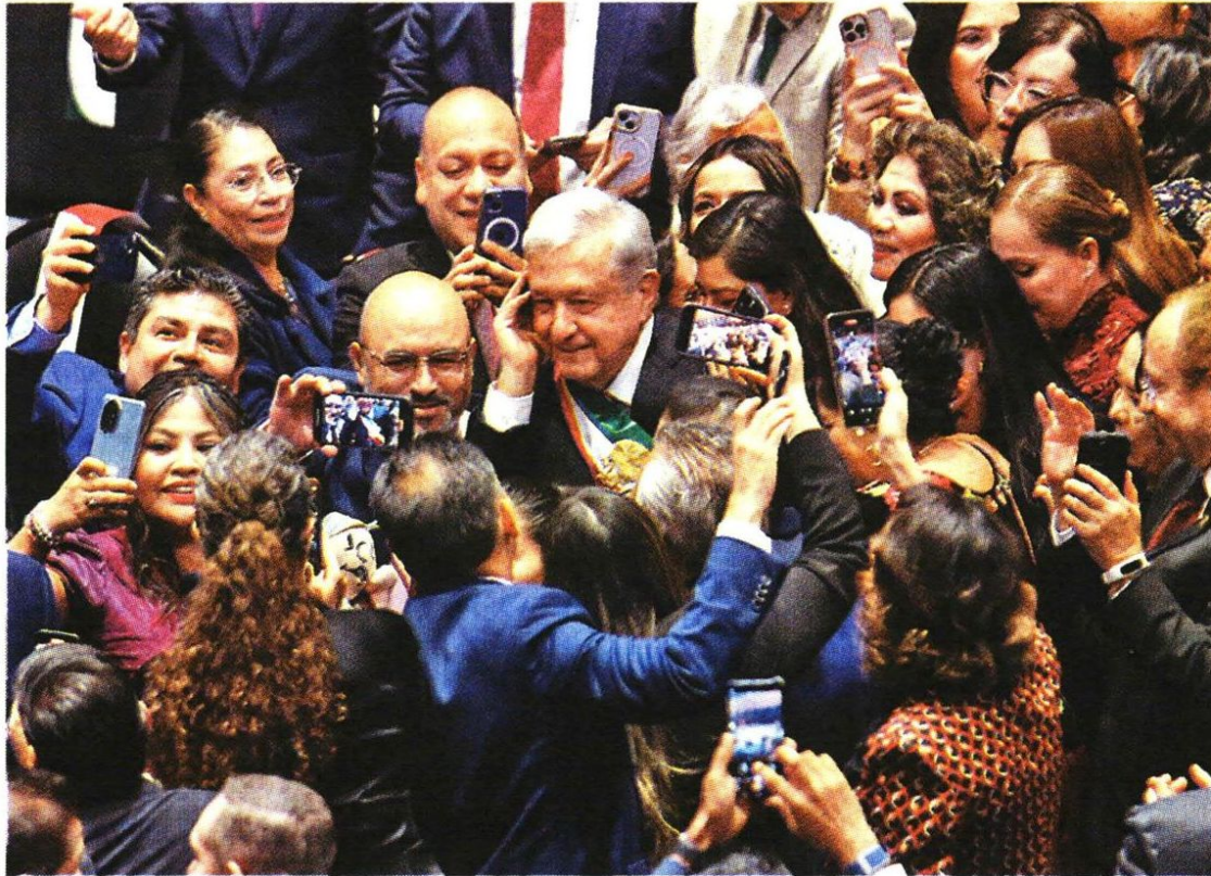
Legisladores aprovecharon la ocasión para sacarse la foto del recuerdo. ARIANA PÉREZ