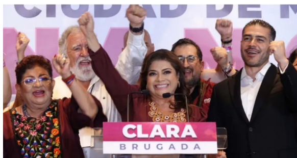
La Jefa de Gobierno Clara Brugada Molina el día en que obtuvo la victoria electoral.

Ella tiene en su historia política el haber gobernado Iztapalapa en tres ocasiones: en 2009, 2018 y su reelección en 2021. Además, fue Diputada local en la Asamblea Legislativa del Distrito Federal, Diputada federal y Diputada a la Asamblea Constituyente de la Ciudad de México.