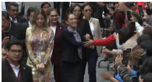
La Presidenta Claudia Sheinbaum Pardo saludando a simpatizantes que están a las afueras del Congreso de la Ciudad de México, donde Clara Brugada tomará protesta como Jefa de Gobierno.

Minutos antes, el Jefe de Gobierno saliente, Martí Batres Guadarrama, llegó a la sede del Poder Legislativo de la CdMx.