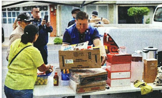
■ Aparetaban vender miel (arriba), pero en realidad eran chelerías en plena vía pública, en Coyoacán.