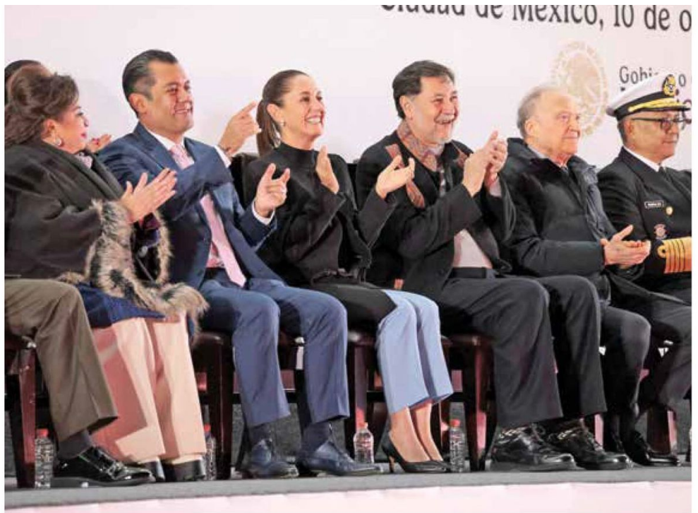
• FIESTA. Celebraron al primer Presidente de México, Guadalupe Victoria, y a la Constitución de 1824.

AÑOS FUE TITULAR DEL EJECUTIVO PORFIRIO DÍAZ.