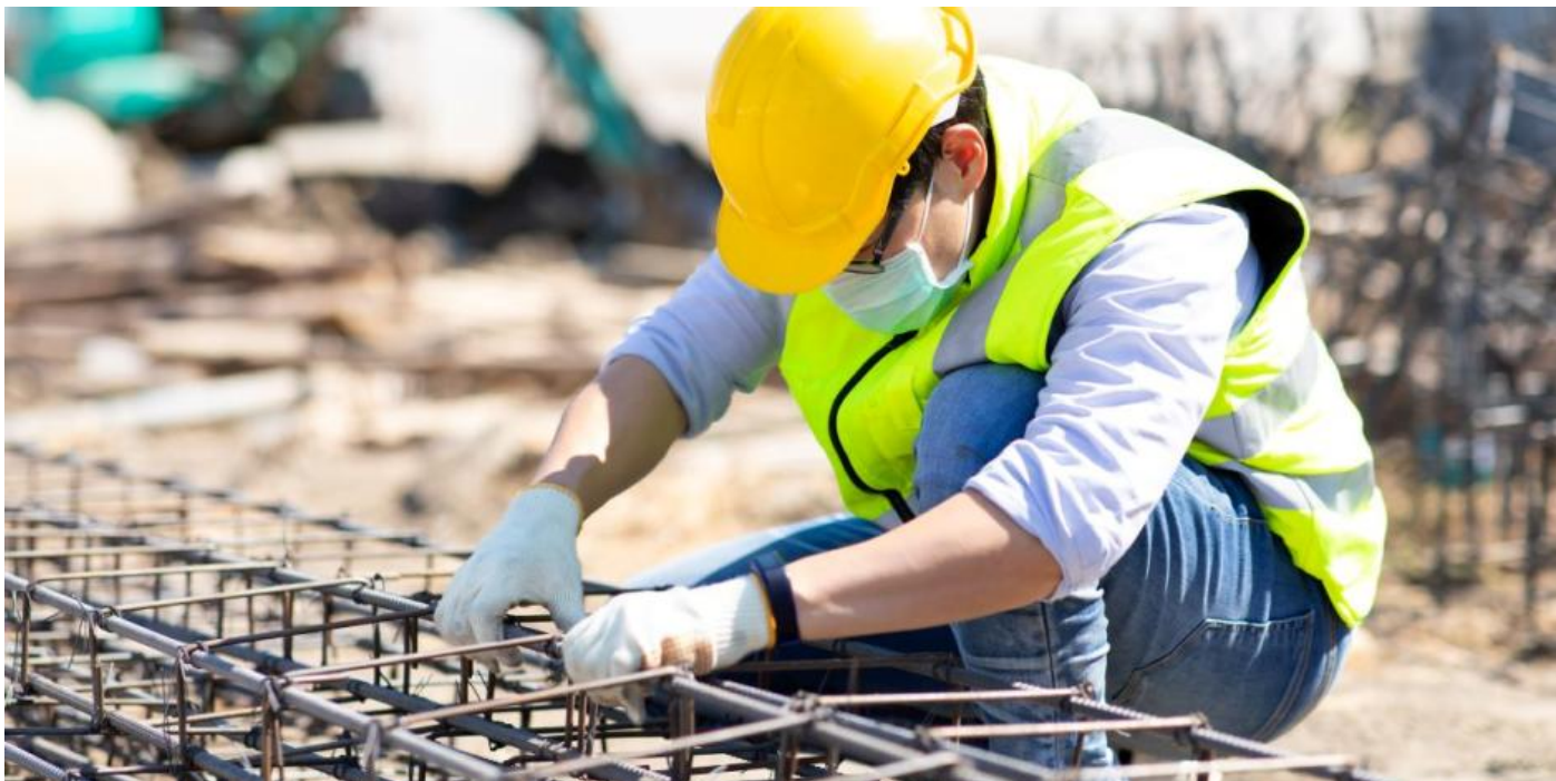
Pide CMIC más participación en obras

Por: CUAHUTLI R. BADILLO - 10/07/2024 01:00