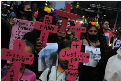
Manifestación contra feminicidios.

La cifra de feminicidios incrementó en los últimos años para la Ciudad de México, con un total de 399 mujeres víctimas de este delito entre 2018 y 2023. El incremento entre el año de inicio, cuando se registraron 47, y el 2023 fue del 29%, ya que en este último año se reportaron 61 feminicidios.