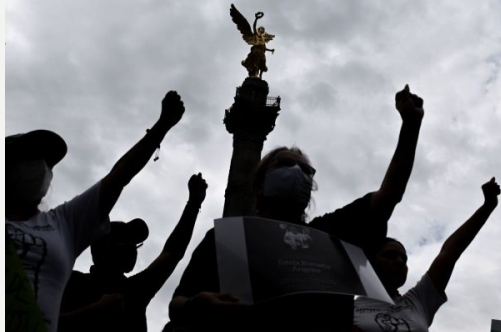
Damnificados del sismo del 19 de septiembre de 2017 realizan un mitin frente al Ángel de la Independencia.

En el último informe de gobierno de Batres, reportó que se habían entregado 10,894 viviendas completamente rehabilitadas o reconstruidas.