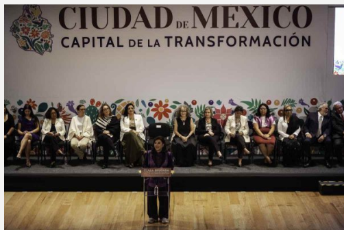
Clara Brugada durante el anuncio de su gabinete.

En cuanto al aspecto financiero, la Auditoría Superior de la Federación (ASF) reportó que a la fecha subsisten irregularidades en el gasto del Gobierno capitalino por 2 mil 018 millones de pesos, ejercidos desde 2018.