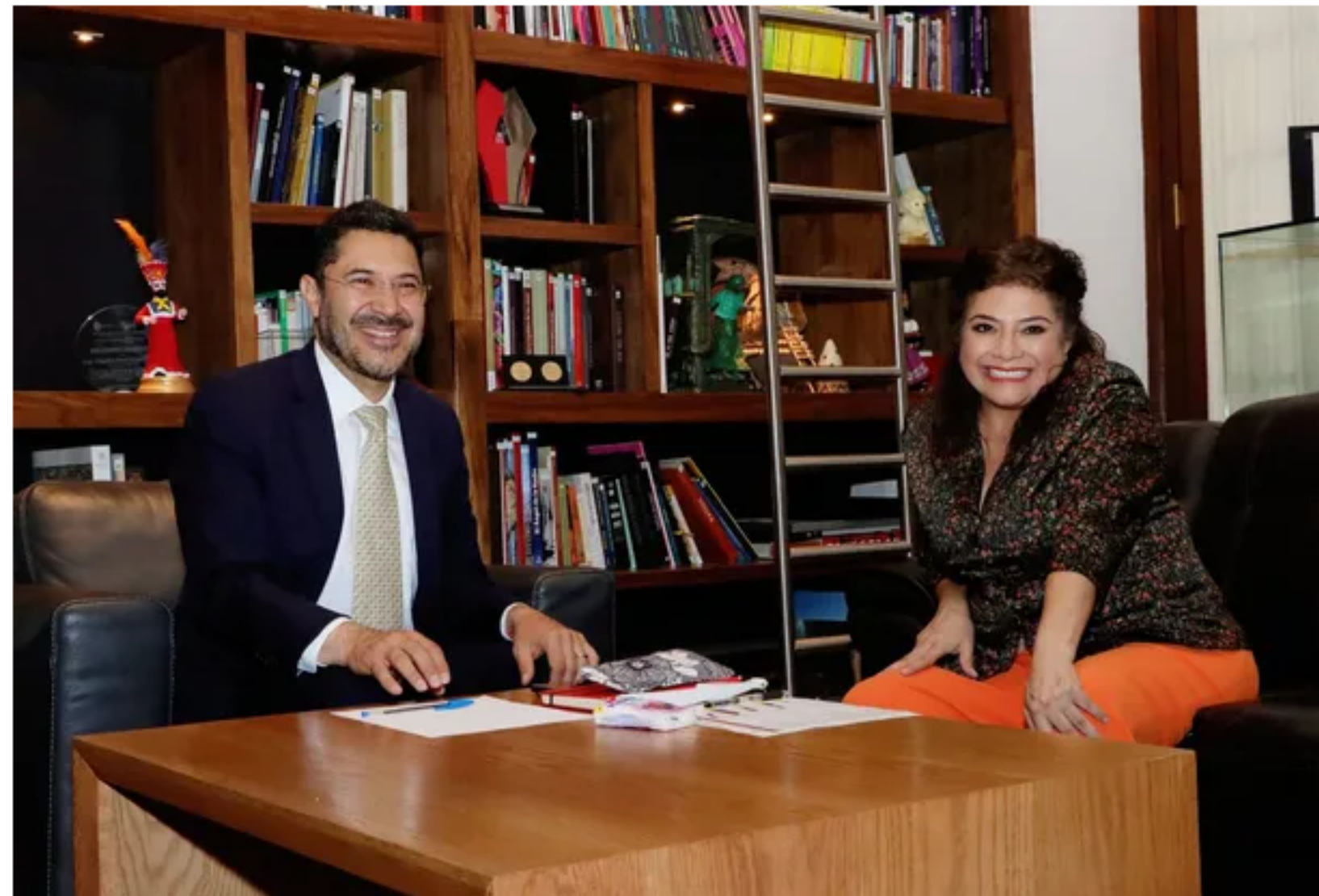
Clara Brugada se reúne con Martí Batres.

La morenista espera cambiar la forma de gobernar la capital del país , pues buscará "territorializar" la administración. En este sentido, adelantó que instalarán una sede del gobierno capitalino en cada alcaldía.