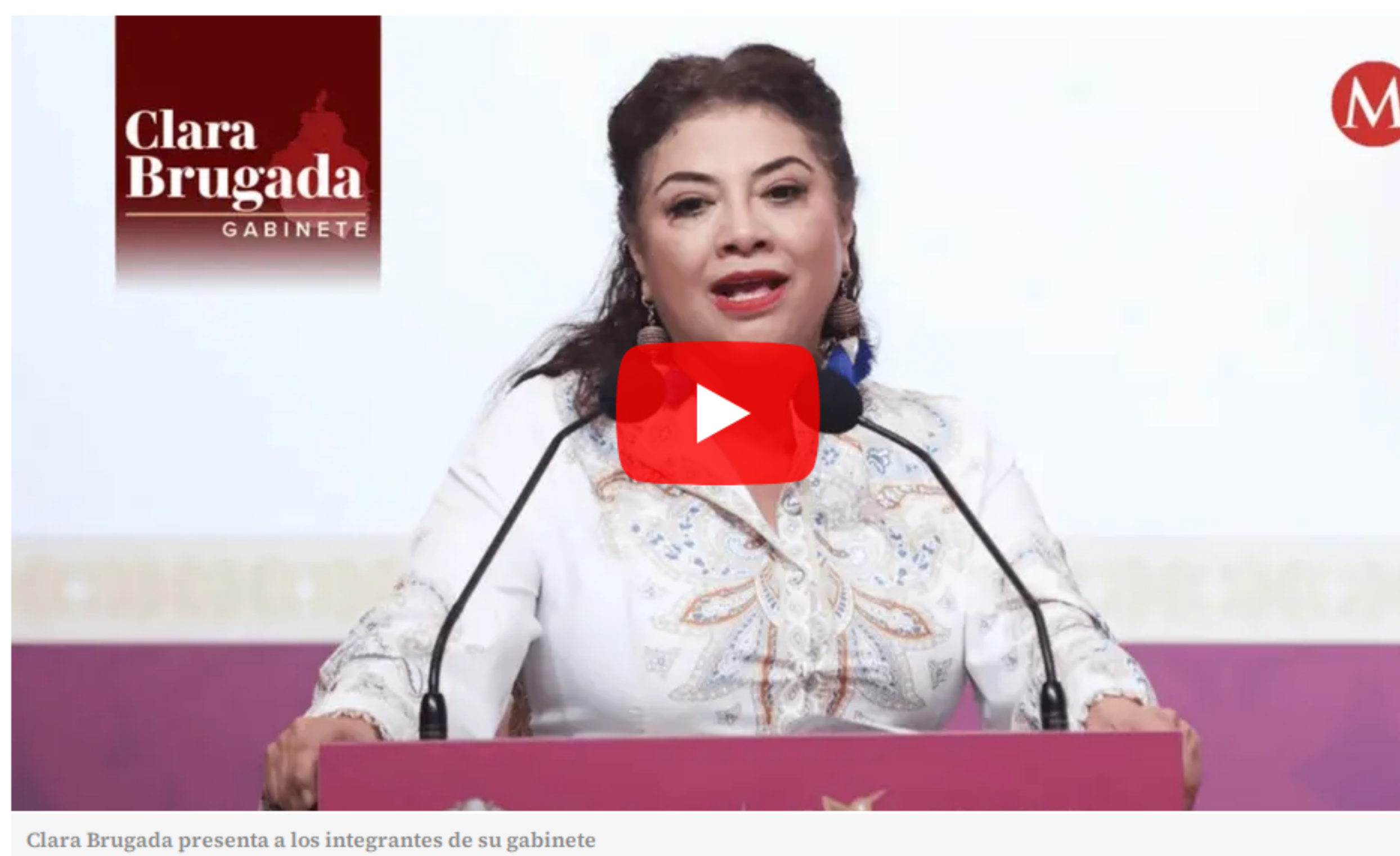
Clara Brugada presenta a los integrantes de su gabinete

La morenista presentó al equipo con el que trabajará durante su gestión al frente de la Ciudad de México.