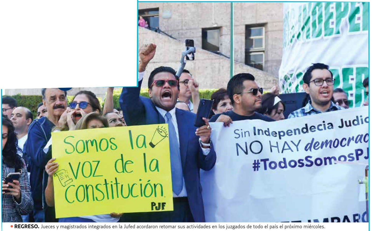
• REGRESO. Jueces y magistrados integrados en la Jufed acordaron retomar sus actividades en los juzgados de todo el país el próximo miércoles.