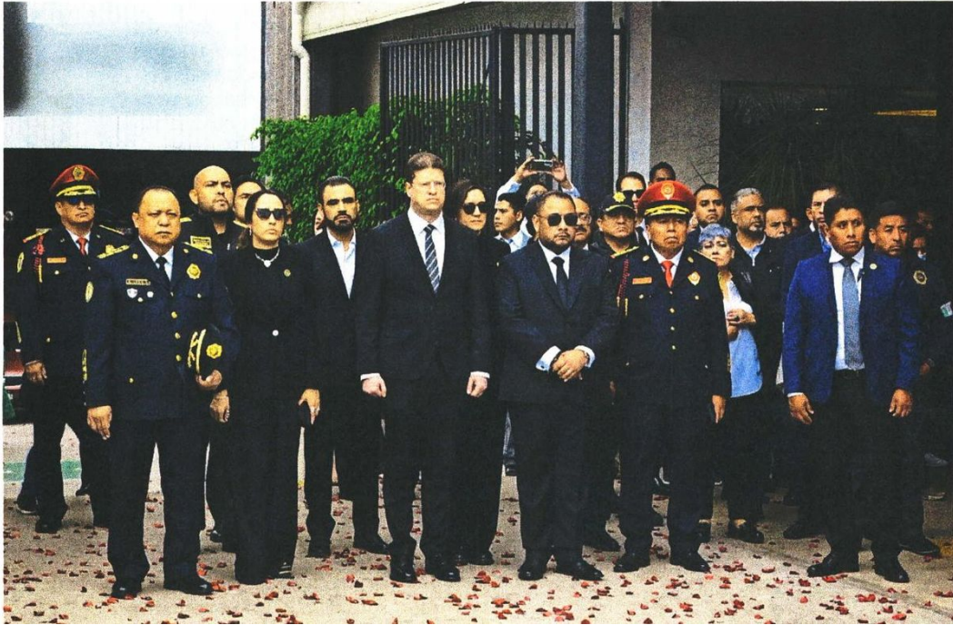
ENTONCES: ECEBERTAL Y POCPE ATUABANDU. EL I. IANNEBERTAL