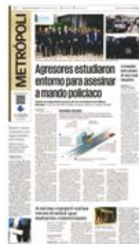
Ilustración: Iván Vargas/EL UNIVERSAL