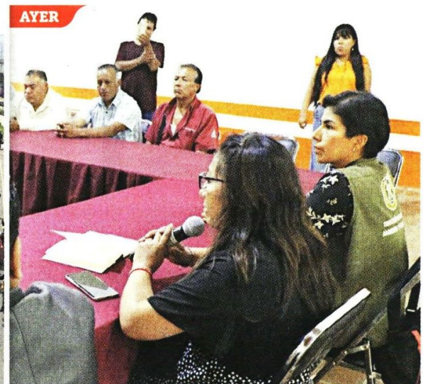
■ En la reunión con autoridades municipales se tocó el tema de la necesidad de regularizar su labor.