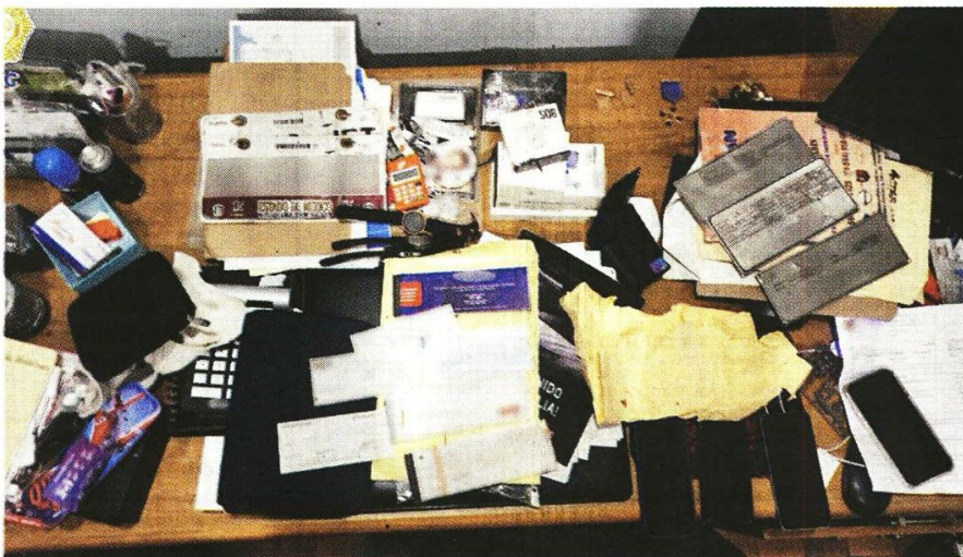
■ Hallaron una impresora y material sintético para la falsificación de huellas dactilares.