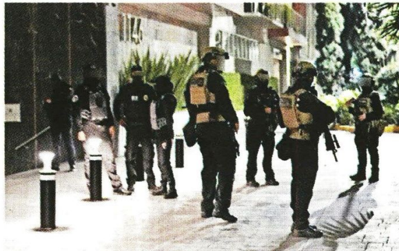
■ El sitio cateado se ubica en la Colonia Letrán Valle. Indagan suplantación de identidad para robo de cuentas a bancos.