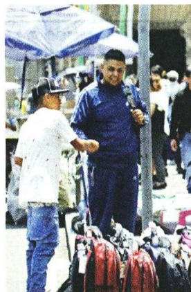
Comerciantes se colocan en distintos puntos de la Alameda para exhibir artículos tendidos en el piso.