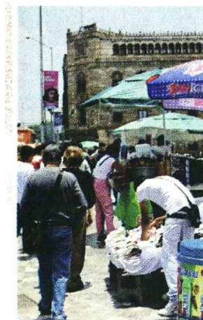
El cerco a la Alameda ha generado protestas y un reacomodo de los comercios informales.